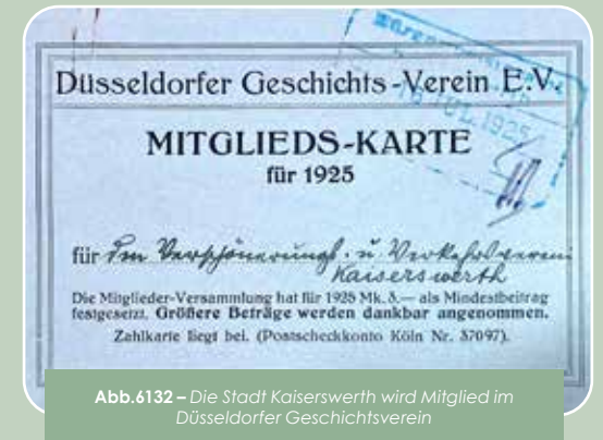
Abb. 6132 – Die Stadt Kaiserswerth wird Mitglied im Düsseldorfer Geschichtsverein

Zwei Themen beschäftigen den Verein über die Jahre hinweg: Der Betrieb der anfangs in Kaiserswerth ansässigen Düsseldorf – Duisburger Kleinbahn* und die am Klemensplatz befindliche öffentliche Waage für Fuhrwerke. Letztere bereitet bereits im ersten Vereinsjahr negative Meldungen. Durch zu schwere Fahrzeuge nahm sie immer wieder Schaden und so entstanden wiederholt Reparaturkosten.