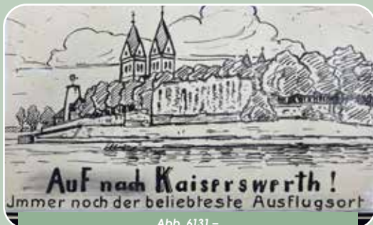
Abb. 6131 – Wochenend-Inserte in mehreren Zeitungen