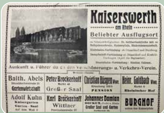
Abb. 6142 – Die Gastwirtschaften waren bei der Werbung besonders präsent

Hier wäre es Aufgabe des in der Nähe wohnenden Gastwirts gewesen, die Übeltäter namhaft zu machen, gar nicht so leicht, wenn ihm die gleichen Herren abends als Kunden seiner Gaststätte gegenüber standen. Dazu vergaß er schon einmal, die eingenommenen Wiegegebühren im Rathaus abzuliefern.