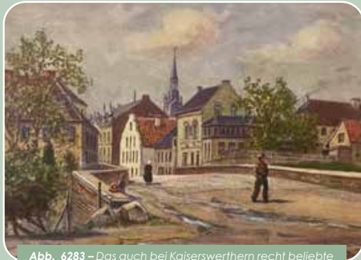
Abb. 6283 – Das auch bei Kaiserswerthern recht beliebte Motiv der Klemensbrücke von Degode