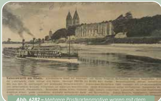
Abb. 6282 – Mehrere Postkartenmotive waren mit dem werbenden Text versehen