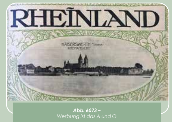
Abb. 6073 – Werbung ist das A und O