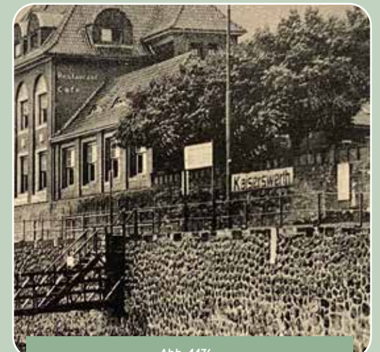
Abb. 4476 – Einladung zur Anlandung in Kaiserswerth